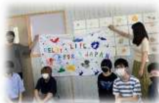
美術の授業。パレードの旗づくり