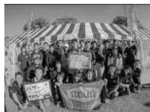
毎年参加している Love Fes までのひとコマです。充実の2日間です。