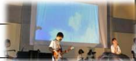
文化祭の目玉のバンド演奏

【その他】スクーリング費用 60,000 円程度/年 ・ プロジェクト授業にかかる実費等