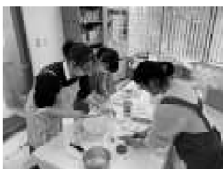
調理実習の様子です。生徒の発想やアイデアを大事にして、取り組んでいます!