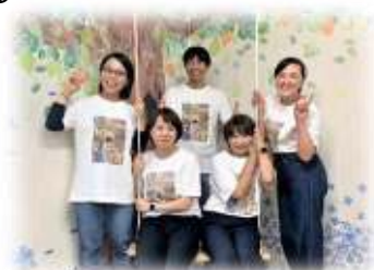
私たちスタッフがサポートしています！！