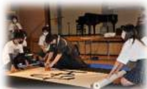
文化祭オープニングは書道パフォーマンス。