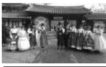
韓国・ソウルに研修旅行に行きました。世界の動きを肌で感じました!