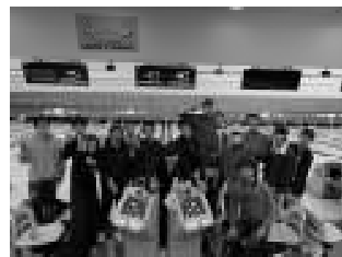
ボウリング大会の様子です! 楽しく体を動かします!