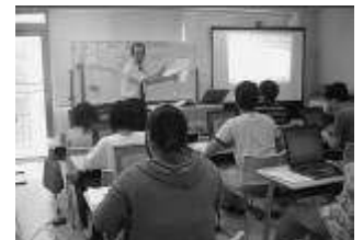
検定試験対策講座の様子です。毎年多くの生徒がチャレンジして合格しています。