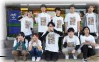
2021 年度文化祭 実行委員