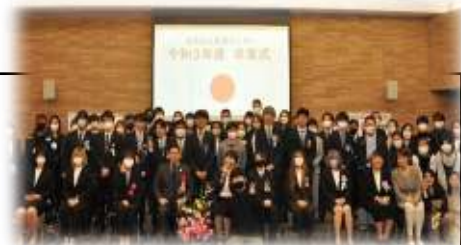
アットホームな卒業式。みんな笑顔で卒業していきます。