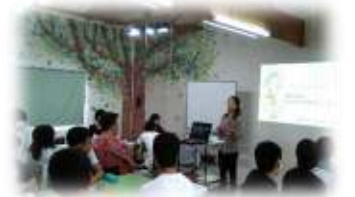
毎月、様々なジャンルの講師をお招きしています。

定期的な面談だけではなく、日々の悩みや将来のことについて随時、面談をしています。