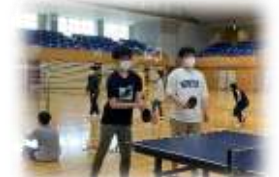
スポーツ大会は好きなものを楽しみます！