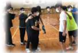
スクーリングの体育の授業！じゃんけん列車。

◆長崎や佐世保、島原方面から通っている生徒もいます。 (大村車両基地駅から徒歩7分)