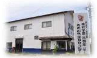
昊天宮の目の前です！