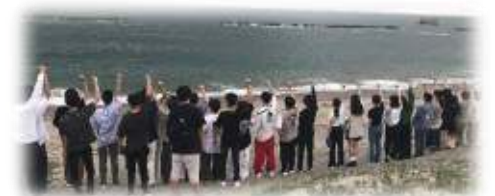
2022夏のスクーリング。鹿児島県いちき串木野市にて