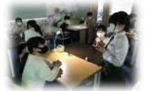
フリースクールの中学生と放課後カフェ