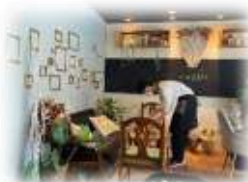
カフェや学童、様々な場所で職場体験

また、社会に出る経験として、在学中にアルバイトを推奨しています。ボランティア活動、職場体験も可能です。