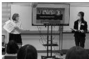
授業の様子です。生徒には英語の名前が付いています!