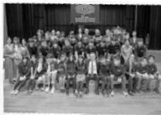
新入生歓迎! 入学歓迎式の様子です。

次のような充実したアクティビティに参加できます。海外研修旅行(中国、韓国)、国内研修旅行(東京)、博物館見学日帰りバス旅行(福岡)、LOVE FESへの出展、文化祭、スポーツ大会、ソフトボール大会、ボウリング大会、バーベキュー大会、Young Americans 長崎公演、おくんち見学、ランタンフェスティバル見学、美術館見学、博物館見学、などなど楽しい行事が盛りだくさんです。写真は一例です。行事では生徒が企画・運営し、主体的に活動しています!(現在は新型コロナウイルス感染拡大防止の為、実施可能なものから実施しています。)