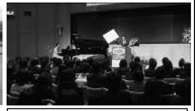
成し遂げた! 卒業式! 在校生も準備から頑張って、卒業生を送り出します。